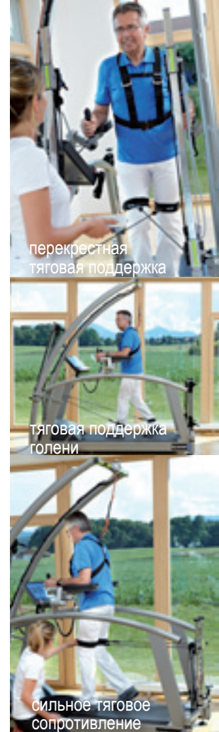
перекрестная тяговая поддержка