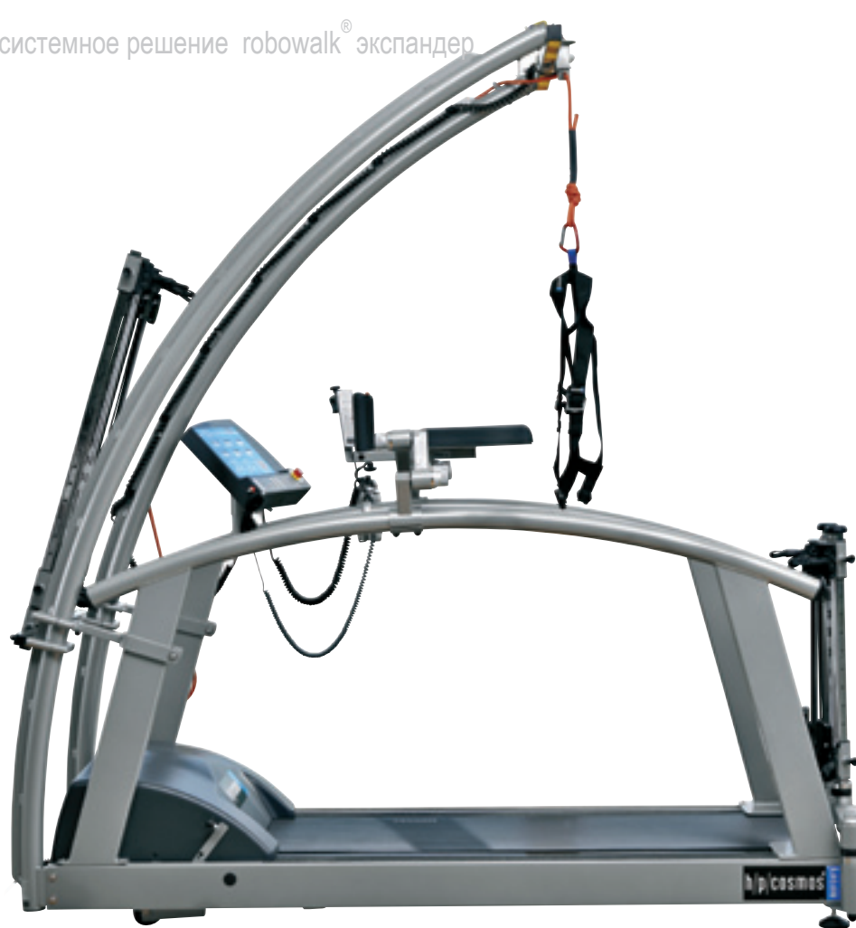
боковая тяговая поддержка